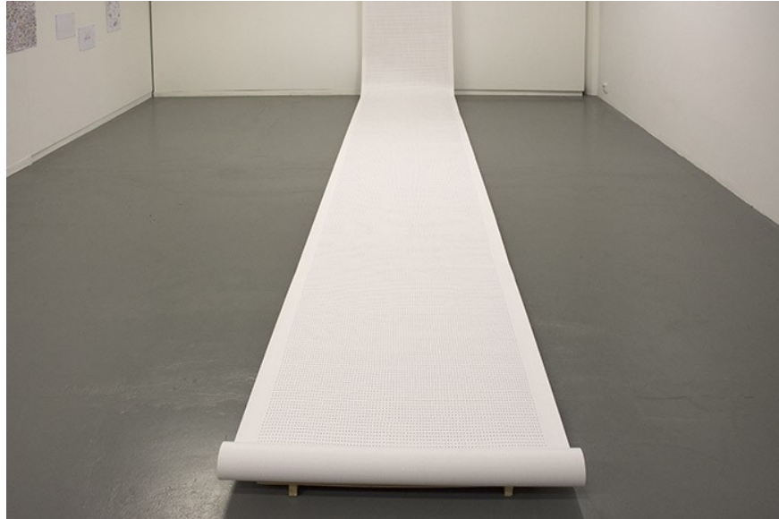
onder